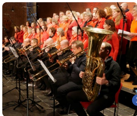
EPIFUNIAS MIT DEM BLÄSER-ENSEMBLE DER APOSTELKIRCHE / LEITUNG: VOLKER GRUNDMANN

Gemeinde wieder von der Empore aus musikalisch begleiten – wenn zu diesem Anlass auch ohne die typischen Chorfarben.