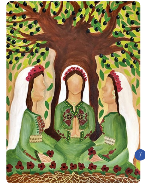
„PRAYING PALESTINIAN WOMAN“ VON DER KÜNSTLERIN HALIMA AZIZ

Der Beginn des Gottesdienstes wird rechtzeitig bekannt gegeben.